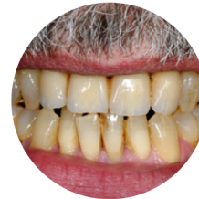
Farbwahl nach TLT eines Teilnehmers und Umsetzung