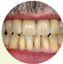
Farbwahl nach TLT eines Teilnehmers und Umsetzung