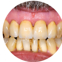
Farbwahl nach TLT eines Teilnehmers und Umsetzung